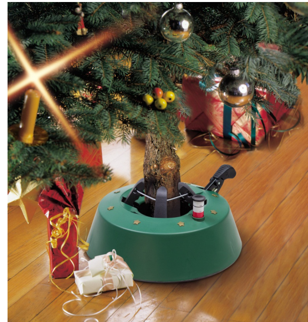
Art. Nr. S200 – Mudel Start1