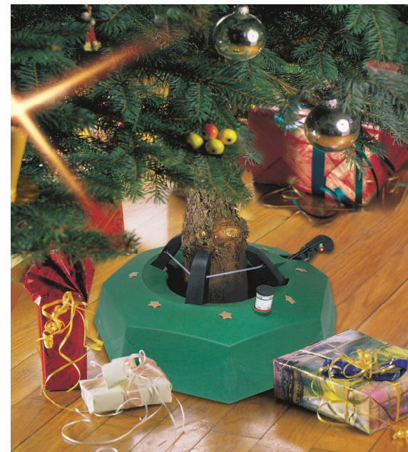
Art. Nr. M250 – Mudel Max2