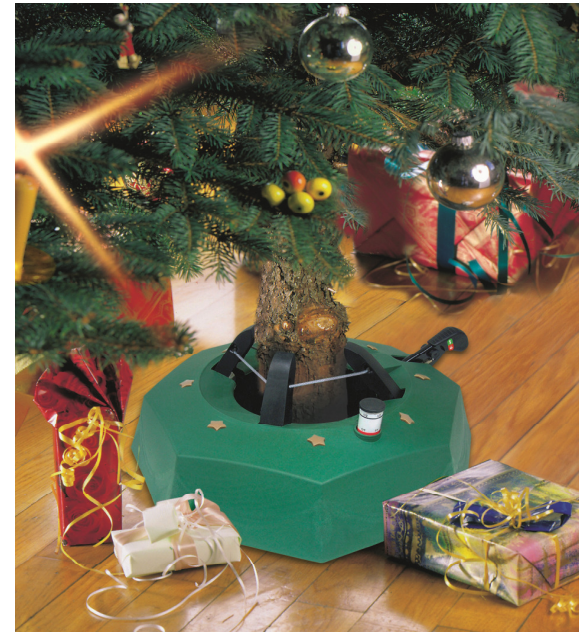
Art. Nr. M200 – Mudel Max1